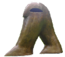
Eurasian Figure female

See below: Construction for the picture panels as street furniture from euro pallets.