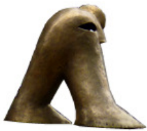
Eurasian Figure male