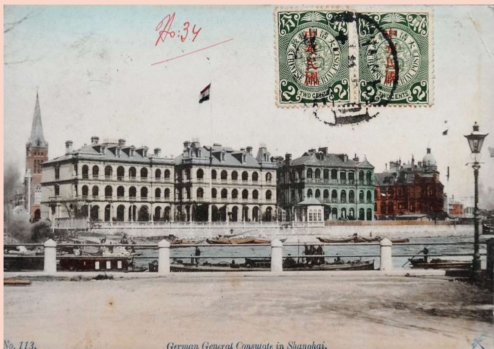
Deutsches Konsulat Shanghai

Shanghai ist damit zum Einfallstor für internationale moderne Architektur in China geworden.