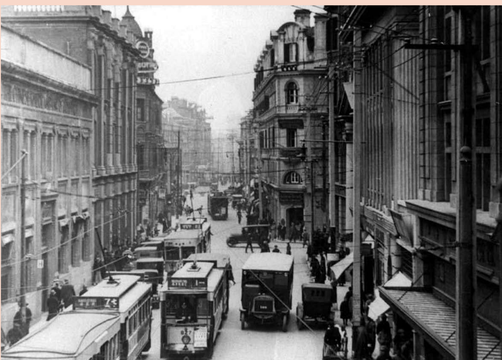
„Jiujiang Road“, ca. 1928