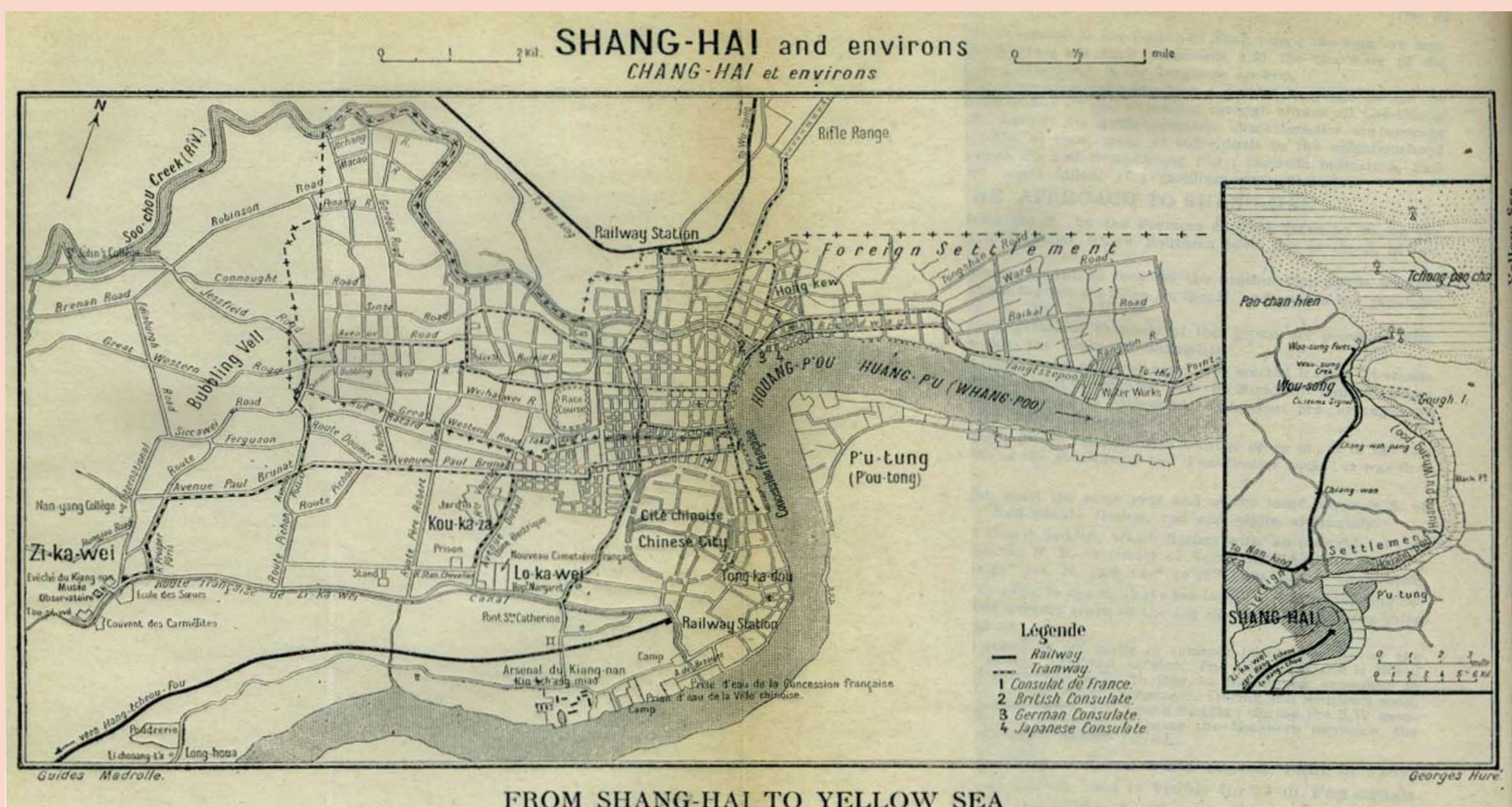
Shanghai, 19. Jahrhundert