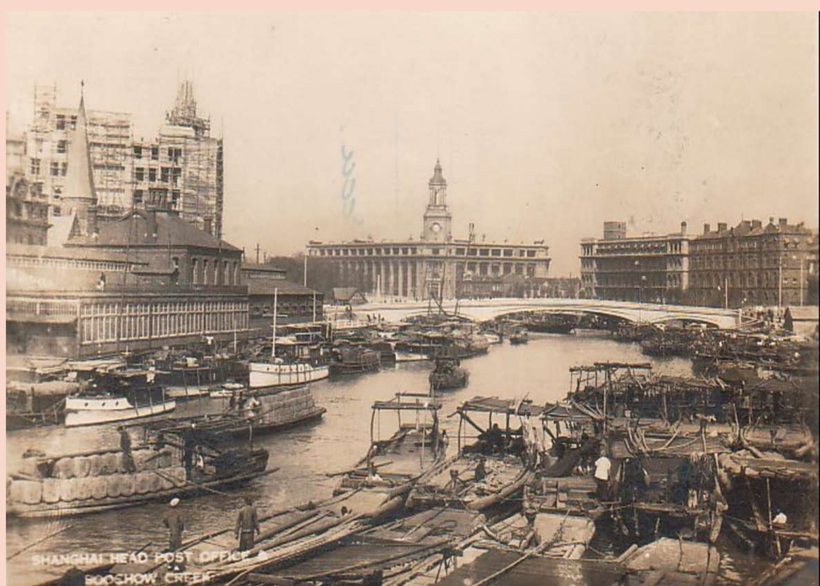
„Suzhou Creek“, 1920