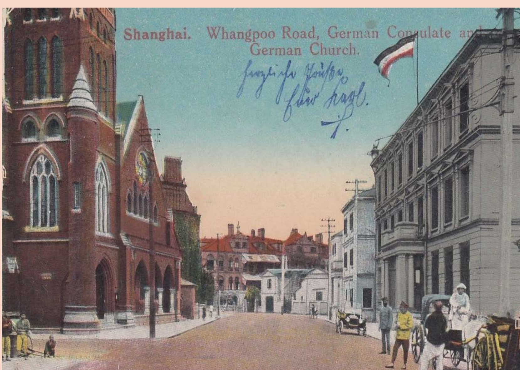
„Wangpoo Road“, deutsches Konsulat und deutsche Kirche