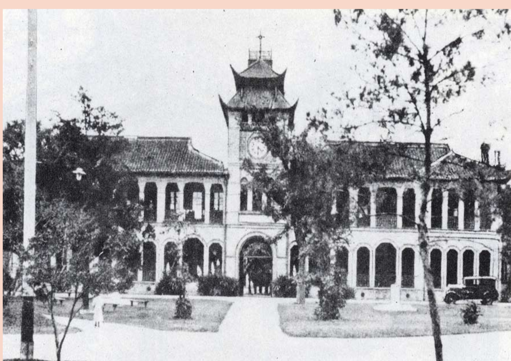
St. Johns-Universität 1879

„Bilden wir also eine neue Zunft der Handwerker ohne die klassentrennende Anmaßung, die eine hochmütige Mauer zwischen Handwerkern und Künstlern errichten wollte! Wollen, erdenken, erschaffen wir gemeinsam den neuen Bau der Zukunft, der alles in einer Gestalt sein wird: Architektur und Plastik und Malerei, der aus Millionen Händen der Handwerker einst gen Himmel steigen wird als kristallenes Sinnbild eines neuen kommenden Glaubens.“ (Auszug aus Bauhaus-Manifest, April 1919)