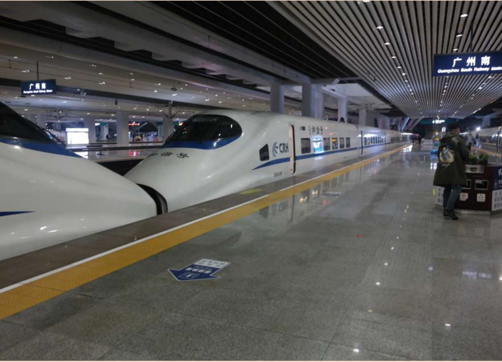
Shanghai, Flughafen Pudong